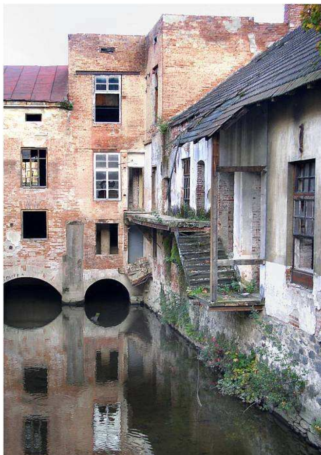
1993 Síla času nebo jen čtrnáct let nezájmu? 2007